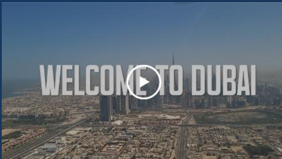
Unser Erklär-Film inkl. Referenzen