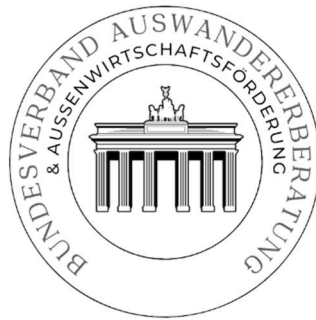
Das offizielle Logo des BVAA. e.V.

enorme Anerkennung seiner Arbeit in diesem faszinierenden Land in den letzten 10 Jahren.